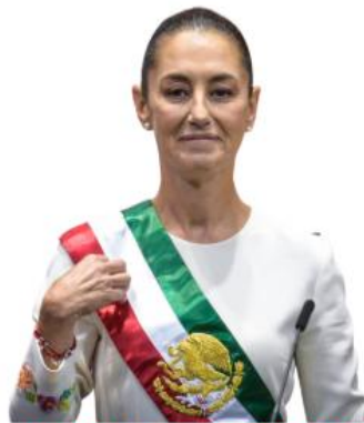
CLAUDIA LA ESTADISTA