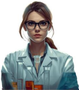
CLAUDIA LA CIENTÍFICA